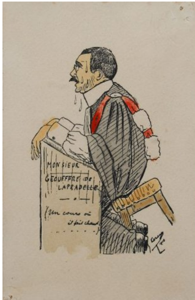
Porträts von Professoren